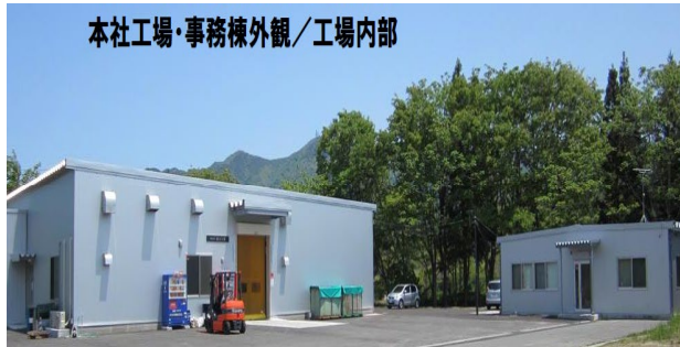
本社工場・事務棟外観/工場内部