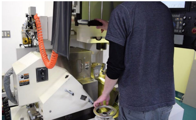
■ 微細な微い研削加工 (プロファイルグラインダー)

株式会社GUPは社員のひとり一人の技と心で 企業のあらゆるモノづくりのお手伝いをします