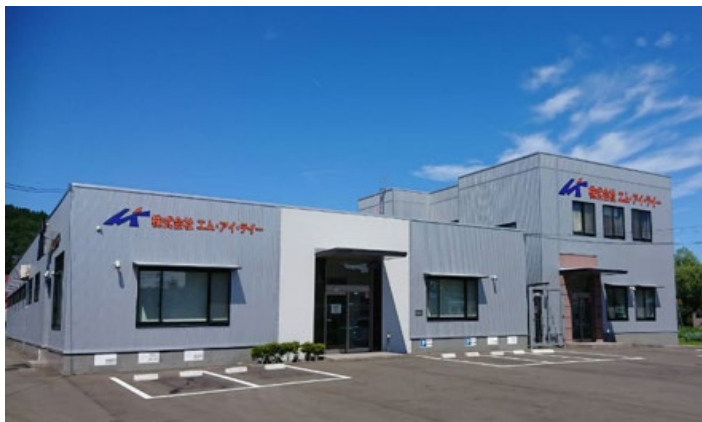
(株)エム・アイ・ティー会社紹介